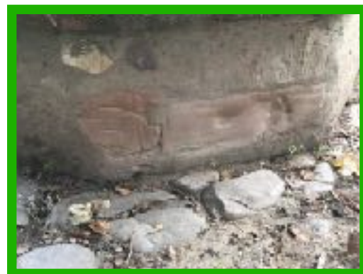
Empreinte du pied de Sigeric et d'un poisson au bas d'une colonne (d'après Danillo)

Les chiffres souvent avancés par les associations et les fédérations se situent autour de 5000 pèlerins par an qui réalisent tout mais le plus souvent une partie de la Via Francigena à pied ou en vélo.