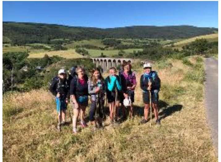
Marcher avec nos petits enfants: des moments privilégiés de partage

Et puis il y a eu la crise sanitaire, des annulations, des doutes. Rassurées par les hébergeurs et l'association Chemin Stevenson, nous n'avons pas renoncé à notre