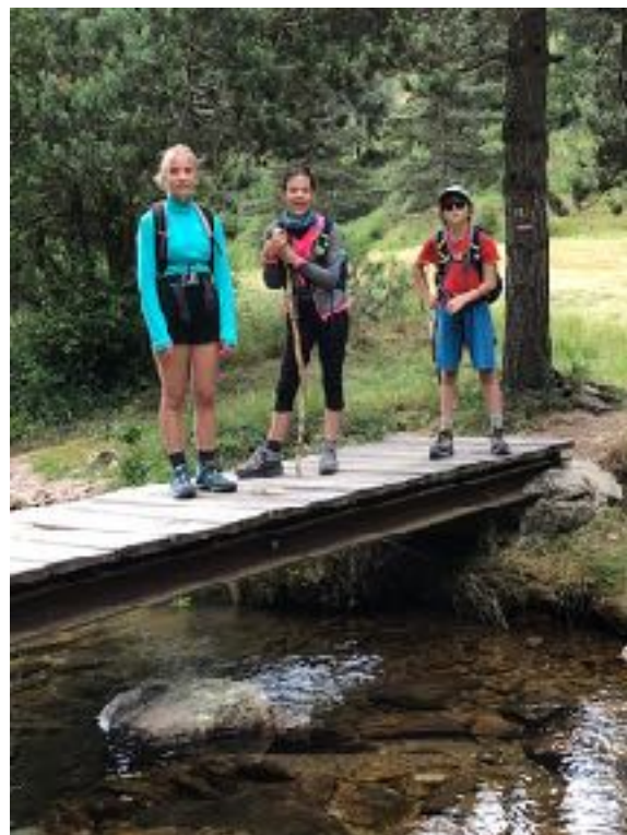
Notre marche s'ajuste aux aspérités du terrain. Nous prenons le temps de nous arrêter, de savourer les paysages toujours magnifiques, une source fraîche, un pont sur la rivière, une baignade ou ... une petite

Le chemin de Stevenson est souvent comparé à celui de Compostelle. Joyau de pleine nature, Il est à l'évidence plus confidentiel.