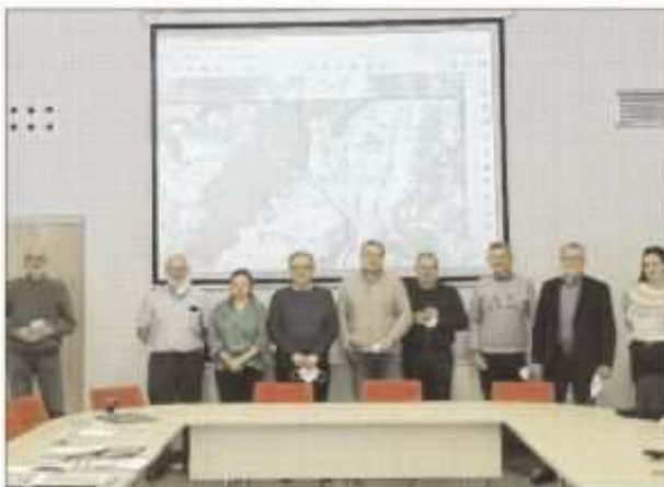
Les acteurs de la via Francigena ont discuté du tracé par Les Premiers Sapins ou par la vallée de la Loue.

Une réunion s'est tenue aux Premiers Sapins en présence des différentes instances (commune, Département, tourisme du Doubs et membres de l'association de la VF ainsi que M.